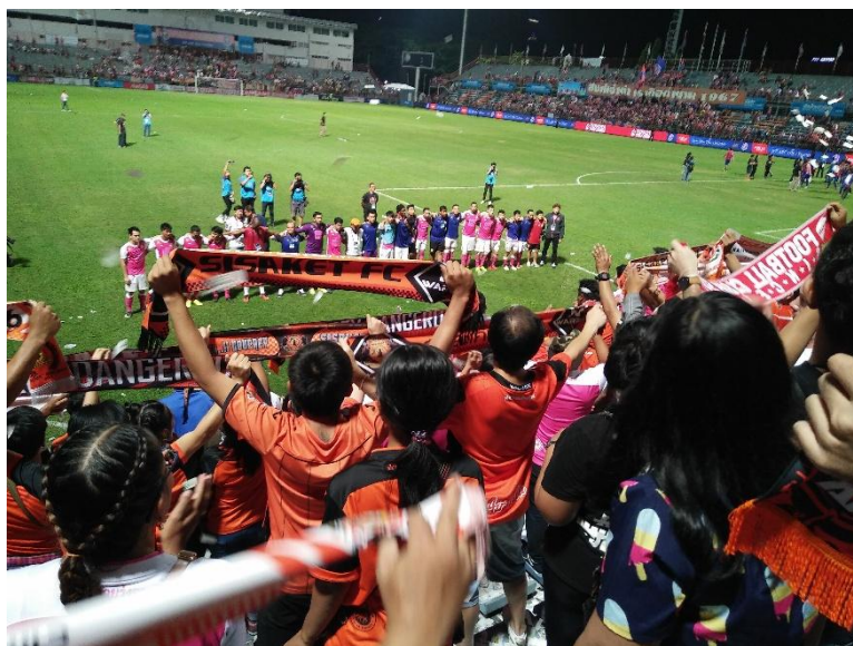
ภาพที่ 1 พื้นที่ในสนามคือพื้นที่ซึ่งให้แฟนบอลได้มีความผูกพันโดยตรงกับทีมฟุตบอลมากที่สุด

การร้องเพลงเชียร์ ไปพร้อมกับทีมบอลที่กำลังทำการแข่งขันอยู่ในสนาม พื้นที่ด้านในสนามบอลคือตัวกลางของการสร้างตัวตนของแฟนบอลที่ผูกไว้กับสโมสรฟุตบอล หากไม่มีสนามฟุตบอลแล้วตัวตนพลัดถิ่นจะไม่เกิดขึ้นหรือสามารถจับต้องได้ โดยเฉพาะอย่างยิ่งกับบุคคลอื่นนอกกลุ่มแฟนบอล นอกจากนี้พื้นที่ในสนามบอลยังเป็นพื้นที่ซึ่งแรงงานพลัดถิ่นสามารถแสดงตัวตนในฐานะแฟนบอลพลัดถิ่นให้คนอื่นได้รับรู้ ผ่านการถ่ายทอดสดการแข่งขัน ผ่านรูปภาพและวิดีโอที่มีการบันทึกตัวของแฟนบอลพลัดถิ่นอยู่ และทำให้ผู้คนภายนอกกลุ่มแฟนบอลได้รับรู้ถึงตัวตนในฐานะแฟนบอลของแรงงานพลัดถิ่น แม้จะไม่ได้อยู่ในสนามร่วมกับแฟนบอลพลัดถิ่น แต่ก็ยังสามารถรู้ถึงตัวตนของแฟนบอลพลัดถิ่น