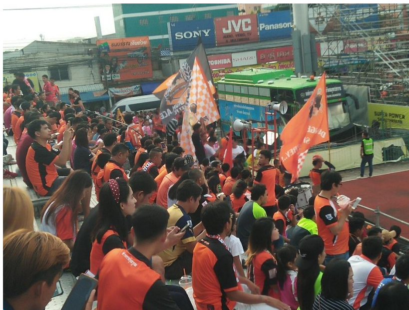
ภาพที่ 4 แฟนบอลศรีสะเกษ เอฟซี ใส่เสื้อแข่งเหย้าของทีมตัวเอง เพื่อแสดงออกถึงตัวตนในฐานะแฟนบอล

สำหรับแฟนบอลพลัดถิ่นอย่างกลุ่มกูปริพลัดถิ่น การแสดงออกของแฟนบอลผ่านการใส่เสื้อแข่งของทีมศรีสะเกษมาเชียร์ถือเป็นสิ่งที่นิยมมากสำหรับแฟนบอล ภาพปกติแฟนบอลกลุ่มกูปริพลัดถิ่นมายังสนามบอลคือการสวมเสื้อที่แสดงออกถึงการเป็นแฟนบอลของทีมศรีสะเกษ ไม่ว่าจะเป็เสื้อแข่งของทีม เสื้อเชียร์ เสื้อโปโล เสื้อยืด หรือกระทั่งเสื้อของกลุ่มแฟนคลับก็ตาม โดยหลักแล้วจะสวมเสื้อแข่งกันมาเป็นหลัก แฟนบอลที่ให้สัมภาษณ์แก่ผู้เขียนหลายคนกล่าวว่าเสื้อแข่งเป็นเสื้อที่พวกเขาต้องซื้อทุกปี และพยายามจะเก็บสะสมให้ครบทุกแบบในแต่ละปี ซึ่งสำหรับแฟนบอลพลัดถิ่นเหล่านี้แล้ว ค่าเสื้อแข่งของทีมบอลนั้นเป็นจำนวนเงินไม่ใช่น้อยสำหรับพวกเขาเลย เพราะตัวหนึ่งก็มีราคาหลายร้อยบาท และหากพวกเขาต้องการเก็บให้ครบทุกแบบในแต่ละปี พวกเขาก็จะเสียเงินที่ประมาณ 1500 – 3000 บาท 14 ซึ่งเป็นจำนวนเงินที่มากพอสมควรสำหรับแรงงานพลัดถิ่นที่ทำงานเป็นชนชั้นล่างรายได้ต่ำในสังคมเมือง อย่างไรก็ตามการซื้อสินค้าเสื้อแข่งของทีมก็สะท้อนให้เห็นความหมายและความสำคัญของตัวตนในฐานะแฟนบอลพลัดถิ่นต่อแรงงานพลัดถิ่น ว่าเป็นตัวตนที่