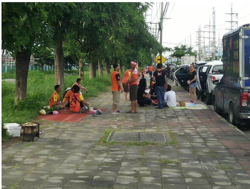
ภาพที่ 2 แฟนบอลศรีสะเกษ เอฟซี รวมตัวกันบริเวณฟุตบอลริมถนน เพื่อรับประทานอาหารกลางวัน

ในทางหนึ่งพฤติกรรมของกลุ่มแฟนบอลพลัดถิ่นที่กระทำบริเวณรอบนอกสนามก็เป็น พฤติกรรมที่ดูแปลกประหลาดและผิดปกติพอสมควร อย่างเช่นการรับประทานอาหารบริเวณโดยรอบ สนามฟุตบอล แม้ว่าบริเวณสนามฟุตบอลส่วนใหญ่จะมีทั้งร้านอาหารและร้านค้ามาขายอาหารให้กับ แฟนบอลที่มาชมเกมที่สนามฟุตบอล แต่แฟนบอลพลัดถิ่นจำนวนมากเลือกที่จะไม่ซื้ออาหารจากร้าน เหล่านี้ แต่ก็นำอาหารที่เตรียมมาจากบ้าน แล้วนำมากินกันบริเวณรอบสนามบอล อย่างการนั่งข้าว เหนียวมาจากที่บ้าน เพื่อนำมากินกับส้มตำหรือปลาเผา ที่แฟนบอลพลัดถิ่นเตรียมวัตถุดิบมา แล้วนั่ง ทำนั่งกินกันสดๆบริเวณริมสนามนั้นเลย