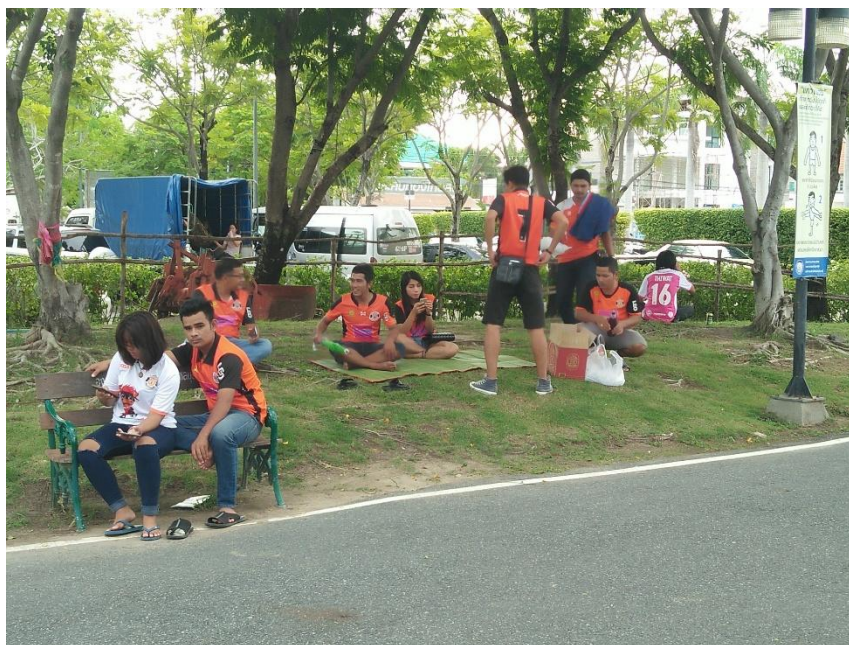
ภาพที่ 3 แฟนบอลทีมศรีสะเกษ เอฟซี นั่งพักผ่อนหย่อนใจก่อนเกมการแข่งขันจะเริ่มขึ้น

บริเวณโดยรอบสนาม เช่น กับพื้นที่ว่างรอบสนาม บริเวณสวนสาธารณะรอบสนาม ใต้ต้นไม้ ริมน้ำ ริมฟุตบาทข้างถนน หรือเปิดท้ายหลังรถกระบะก็ตาม จึงเป็นภาพปกติที่ดูไม่ปกติซึ่งสามารถพบได้ทั่วไปของแรงงานพลัดถิ่น กับการนั่งกินข้าว กินเปียร์ ระหว่างเพื่อนฝูงหรือครอบครัวบนเสื่อบริเวณพื้นที่โดยรอบของสนามฟุตบอล